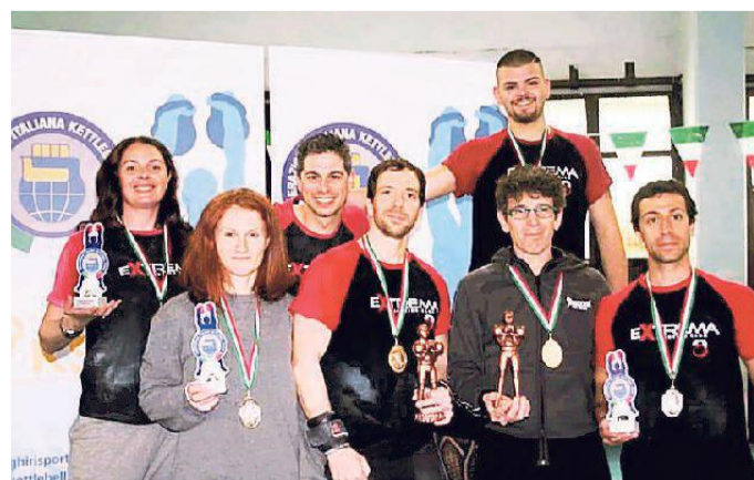
Foto di gruppo per gli atleti e le atlete dell'Extrema Fighting